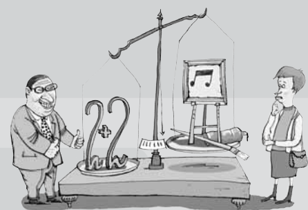
Forsidetegning Claus Bigum

Debatforløbet om fremtidens folkeoplysning er afsluttet, og nu gælder det om at formulere retningslinjerne for folkeoplysningen og Samrådet i de kommende år.