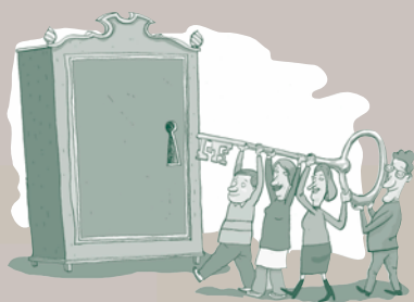
Forsidetegning Claus Bigum