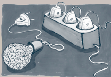
Forsidetegning Claus Bigum