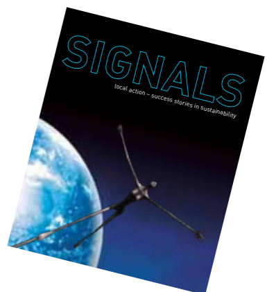
64 Signal-local action success stories in sustainability. Stiftelsen Idébanken 2011. Boken ble gitt til deltakere på Nordic - Baltic conference "Solutions local, together" i januar 2011 i Turku

Vårt forslag er at rapporten blir grunnlaget for et tverrsektorielt nordisk samarbeid, der oversikten og eksemplene er utgangspunkt for gjensidig læring og inspirasjon. Målet må være å bidra til å utvikle hensiktsmessige og effektive strategier for utvikling og implementering av nye utdannings elementer innen klima og miljø. Begrepet utdanning må i denne sammenhengen utvides og utvikles slik at det favner forskjellige læringsarenaer, følger opp en tverrsektoriell tenkning og omfatter alle voksne som målgruppe.