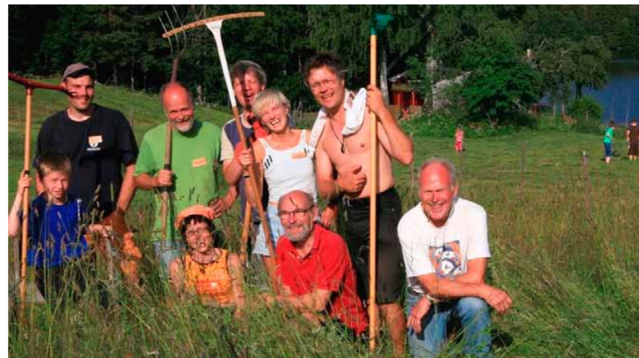
En glad gjeng i enga.