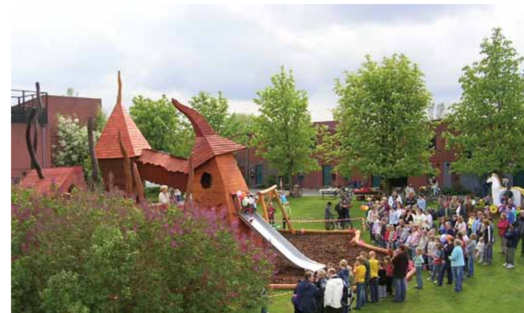
Innvielse av naturlekeplassen i Hyldebjerg

utvikle demokratiet”, i Norge er det en skole for ”folkeopplysning og allmenn dannelse”, i Danmark for ”livsopplysning, folkeopplysning og demokratisk dannelse”. Med slike kjerneverdier, er folkehøgskolene en egnet arena for kunnskap for en bærekraftig utvikling.