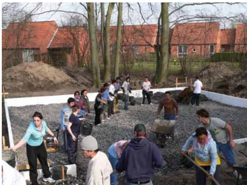
Alle deltar i en flerkulturell og økologisk byggeprosess