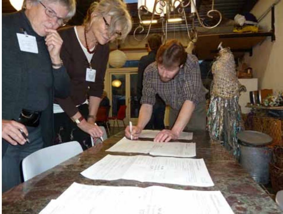
Livslang læring: Samarbeid om tiltak bærekraftig utvikling.