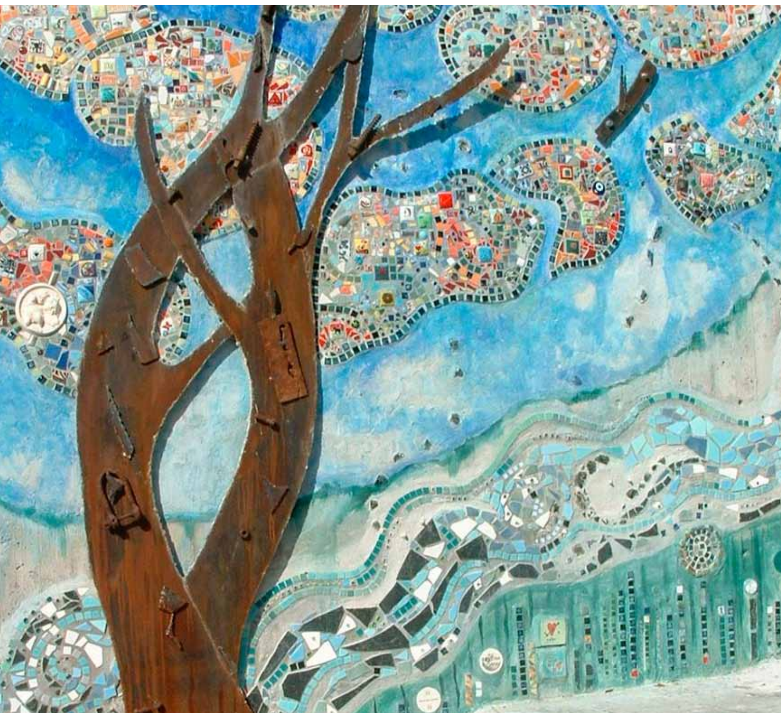
"Livets tre" - en bit av veggkunsten

en oversikt over tilbud til voksne i Norden