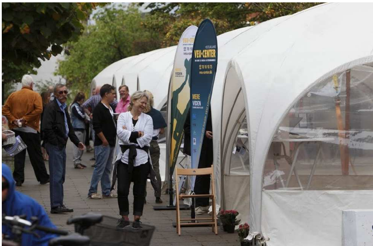
Et kig ned ad Stenstuegade