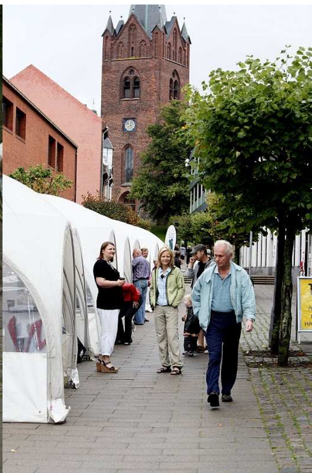
Et kig op ad Stenstuegade

Dagen forløb rigtig godt trods det mindre gode vejr og svigtende besøg. Vi havde placeret os i Stenstuegade, hvor Slagelse Bibliotek også har til huse, og her er normalt har mange besøgende lørdag formiddag, men desværre ikke denne formiddag.