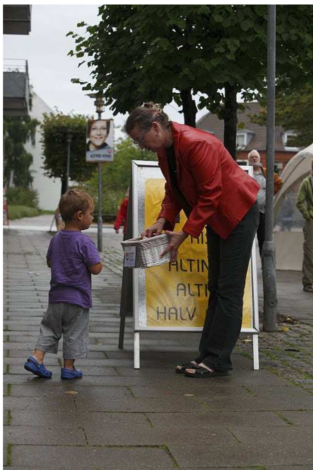
Frugt til både store og små

Højt humør og engagement var kendetegnet for lørdag morgen, hvor der var stor aktivitet i alle telte med klargøring af stand og aktiviteter. Alle mødte med store forventninger, og det var en præstation i sig selv, at hver enkelt organisation kunne stable noget på benene med så kort varsel.