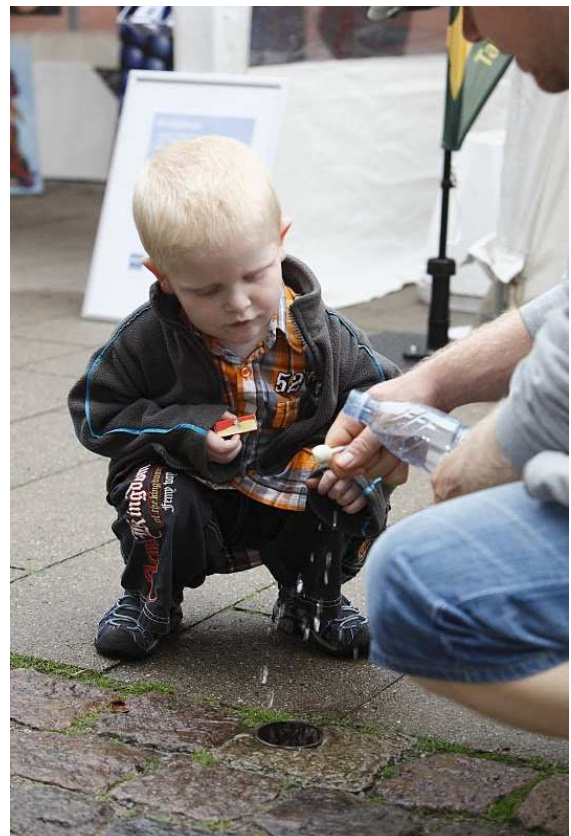
VEU var parat med vandet, da slikkepinden havde været en tur på jorden!