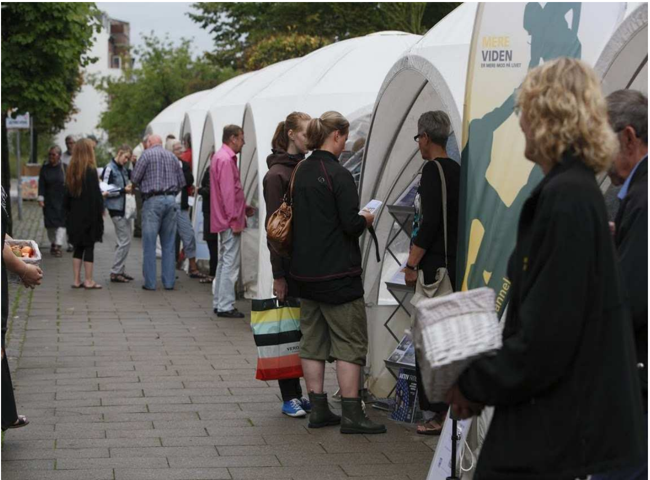
Livlig snak i teltene