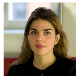
Lotte Hansen