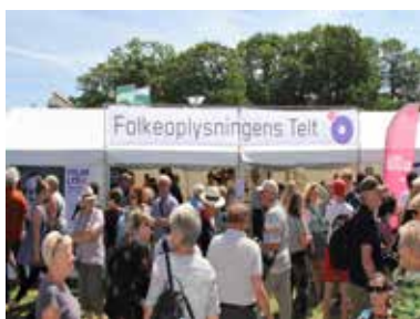
Folkeoplysningens Telt på Folkemødet på Bornholm