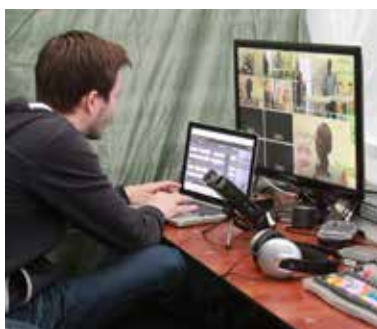
SLRTV sørgede for streaming af arrangementerne i Folkeoplysningens telt på Folkemødet.

Sammen med Bornholms Tidende stod vi for "folkets talerstol", Speakers' Corner. Igen i år stillede ca. 80 talere op. Antal-