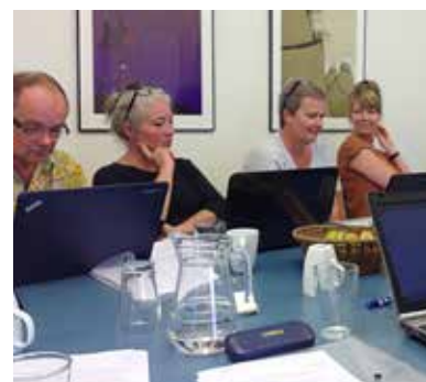
Deltagerne i Digitalt Lærings Forum undersøger de digitale værktøjer.

I juni afholdt styregruppen, bestående af repræsentanter fra Undervisningsministeriet, Kulturministeriet, VEU-centre, Danske SoSu-skoler, Lederforeningen for VUC, Danmarks Biblioteksforening og DFS et inspirationsseminar. Her deltog tre udenlandske oplægsholdere fra Slovenien, Irland og Holland. De delte deres mange års erfaringer med at koordinere 'Lifelong Learning Week/Lifelong Lear-