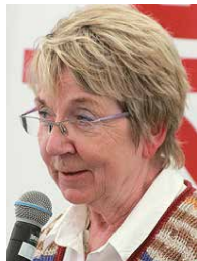
Kulturminister Marianne Jelved udsender en "National vision for folkeoplysningen".

På den kommunalpolitiske front har DFS i 2014 koncentreret sine kræfter om at motivere til og styrke de eksisterende lokale samråds arbejde med lokal interessevaretagelse i forhold til politikere og embedsværk. Der har været udsendt tre nyhedsbreve direkte til medlemmer af de lokale folkeoplysningssamråd, og der har løbende været bragt nyheder i DFS' elektroniske nyhedsbrev om det kommunale område, herunder historier fra lokale samråd, der har markeret sig med en særlig indsats i forhold til interessevaretagelse. Herudover var emnet