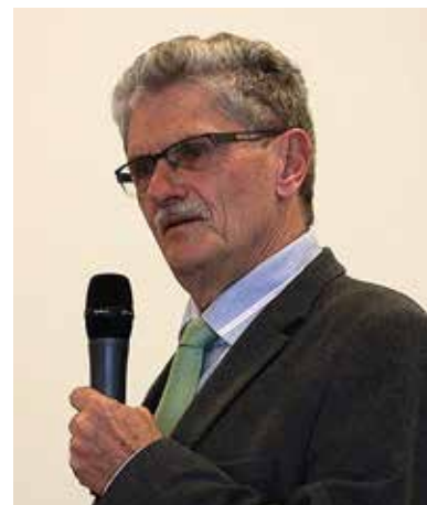
Folketingets formand, Mogens Lykketoft, var gæstetaler på repræsentantskabsmødet i april 2014.