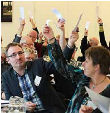
Kun de delegerede kan stemme på repræsentantskabsmødet.