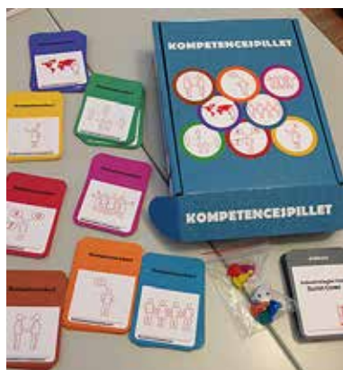
Kompetencespillet kan bruges til afklaring af realkompetencer. Spillet kan rekvireres hos DFS.