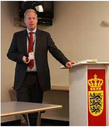
Bestyrelsen afholdt i efteråret sit strategiseminar i Bruxelles og besøgte bl.a. Danmarks Faste Repræsentation ved EU.