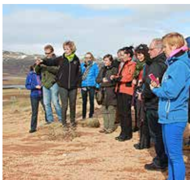
De nordiske og baltiske samråd mødtes i 2014 i Island.

DFS er også medlem af International Council for Adult Education (ICAE). Foreningen repræsenterer mere end 800 foreninger og organisationer inden for voksenundervisning og livslang læring. Den har syv regionale medlemmer (bl.a. EAEA fra Europa) og nationale medlemmer fra mere end 75 lande. ICAEs økonomi er baseret på medlemskontingenter og donationer. Samtidig er ICAE afhængig af økonomisk støtte fra NIACE (England) og DVV-International (Tyskland) og bistandsmidler fra Schweiz. ICAE fik i 2014 ny generalsekretær, Katarina Popovic fra Serbien.