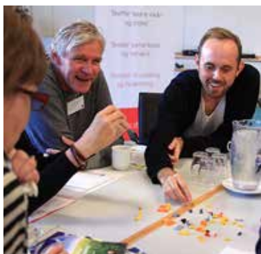
LEGO-figurer blev brugt ivrigt af deltagerne på DFS' medlemskonference på KolleKolle.

DFS har i mange år indstillet eller udpeget repræsentanter til en række råd, nævn og udvalg. Disse repræsentanter skriver en gang om året en kort beretning om deres virke til DFS' årsberetning. Repræsentanterne mødes en gang om året i november for at udveksle erfaringer og drøfte fælles udfordringer. I 2012 blev der udarbejdet et fælles mandat for arbejdet. Beretningerne i denne årsberetning indledes med en omtale af det fælles mandat, og i hver beretning gøres der kort rede for baggrunden for, at DFS er repræsenteret. På mødet i november 2014 blev der lagt vægt på erfaringsudvekslingen og der blev drøftet en fælles kampagne for flere folkeoplysningsrepræsentanter overfor ministerierne.