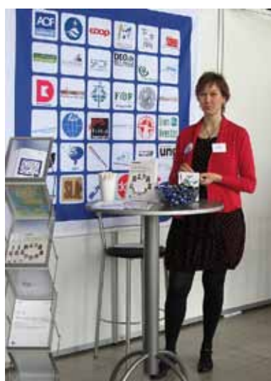
DFS havde en stand på KL's Kultur- og Fritidskonference i Silkeborg.

Vifo er et uafhængigt videncenter og er oprettet som en selvstændig del af Idrættens Analyseinstitut (Idan). Det var et af de bedste konkrete resultater af Det Nationale Folkeoplysningsudvalgs arbejde, som DFS var en del af. Centret er finansieret af Kulturministeriet med seks millioner kr. over en treårig periode, hvorefter det skal være selvfinansieret.