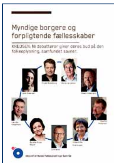
Kredsens visioner, samlet i bogen her, blev trykt i 1.600 eksemplarer.

I efteråret var regeringen, hjulpet af Frivilligrådet og DUF, vært ved fem regionale møder, der skulle sætte den lokale proces i kommunerne omkring ud-møntningen af charteret i gang. Fra DFS' side har vi gjort meget ud af at opfordre