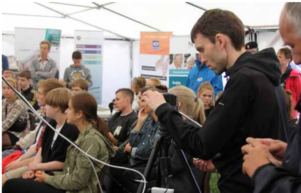
DFS videostreamede en række af møderne i Folkeoplysningens telt, så interesserede kunne følge med på internettet.

Bornholms borgmester, en journalist og en af de folkemødedeltagere, der havde indleveret en nominering. Prisen gik til folketingsmedlem Esben Lunde Larsen (V).