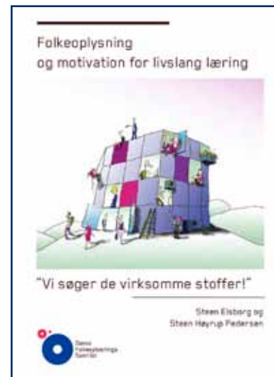
DFS udgav rapport om motivation for livslang læring og præsenterede den på møder i Århus og København.

Prisen blev uddelt på grundlag af lidt over 100 nomineringer fra menige folkemødedeltagere, fordelt på knap 50 forskellige politikere. Vinderen blev udpeget af en jury bestående af DFS' formand,