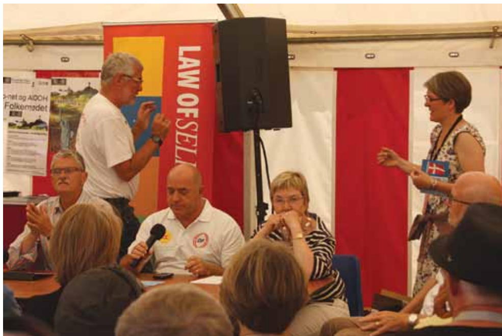
Debatmøde i Folkeoplysningens Telt på Folkemødet i Allinge. I panelet er det fra venstre Mogens Lykketoft (S), Søren Espersen (DF) og Marianne Jelved (R).

Speakers' Corner er den åbne folkets talerstol på Folkemødet. I 2011 var det en begrænset succes med få talere og få tilhørere. Efter aftale med Folkemødesekretariatet indgik DFS et partnerskab om talerstolen med 2011-arrangøreren, Bornholms Tidende. Vi åbnede mulighed for for-booking af tider på talerstolen, styrkede værtsfunktionen, forbedrede forholdene foran scenen og gjorde en aktiv indsats i DFS' medlemsorganisationer for at skaffe relevante talere. Resultatet blev en markant fremgang i antallet af talere, i alt 88 i løbet af de fire dage. Der var også en pæn fremgang i antallet af tilhørere, som kunne gå i dialog med talerne. Ti talere fra folkeoplysningen havde på forhånd booket sig ind på talerstolen. Flere af dem inviterede umiddelbart bagefter til videre debat i Folkeoplysningens Telt.