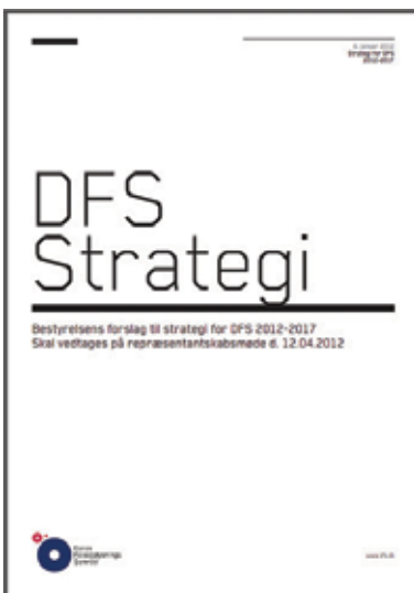
Forslaget til ny 5-årig strategi blev lanceret i januar 2012.