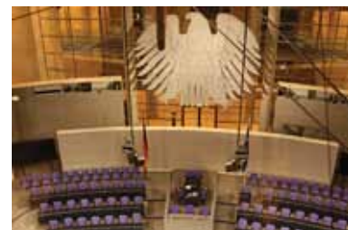
Bestyrelse og konsulenter var i november i Berlin og mødtes her bl.a. med repræsentanter for Deutscher Volkshochschul Verband.