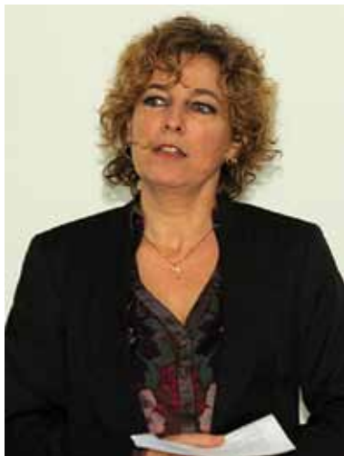
Undervisningsminister Christine Antorini talte på DFS' repræsentantskabsmøde i april 2012.

og undervisningsministeren talte på repræsentantskabsmødet i april. Ved disse lejligheder havde vi mulighed for at præsentere en række sager af interesse for DFS og medlemsorganisationerne og diskutere dem med politikerne. Parallelt med dette var sekretariatet i løbende kontakt om små og store sager med embedsmænd i de to ministerier. Det samme gjaldt i mindre omfang de tre andre ministerier, der er relevante for folkeoplysningen: Socialministeriet (det frivillige arbejde), Beskæftigelsesministeriet (beskæftigelsesrelaterede kurser) og Uddannelsesministeriet (Nordisk Ministerråds og EU's støtteprogrammer til folkeoplysning).