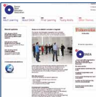
DFS har nu også fået en udbygget engelsproget hjemmeside - www.daea.dk

Daea.dk kan også anvendes af medlemsorganisationer, som ikke selv har en engelsproget hjemmeside, men som lejlighedsvis har behov for at præsentere folkeoplysningen og deres virke overfor ikke-dansktalende kolleger.