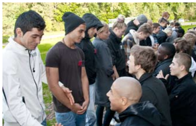
"speed dating" på årets hyttetur 2011 - Tema: hvad er go' stil på APS?

Århus Produktionsskole har en "smertegrænse" på 50 % nydanske elever, som de helst ikke vil over. Det dækker dog over en meget stor spredning mellem værkstederne. På de kreative værksteder (teater, foto m.v.) er der stort set ikke nydanskere, hvorimod der kan være helt op til 70 % på håndværkerværkstederne.